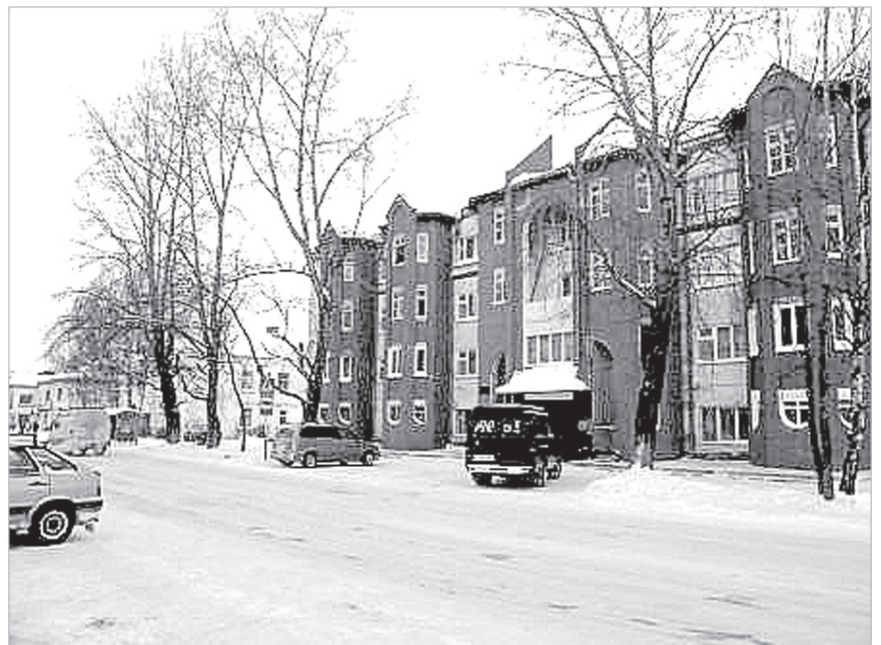
Карса администрациялөн керка