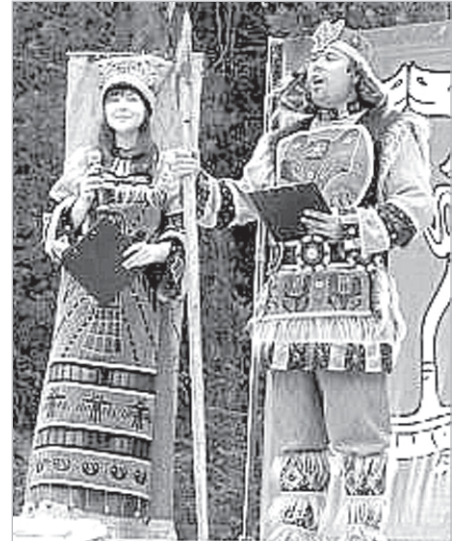
Кудым ош да Зарань