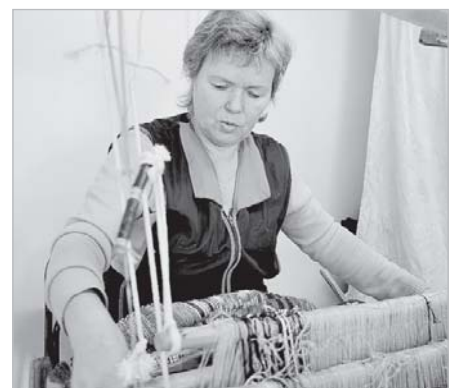
Оз вунöдны важся оласног