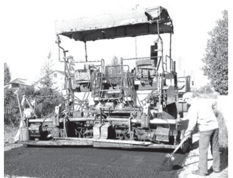
Ремонт дороги в с. Усть-Кулом

В течение 2012 года постоянно оказывалась консультативная, методическая и практическая помощь специалистам администрации сельских поселений в организации и подготовке первых организационных заседаний Советов сельских поселений III созыва. Были разработаны шаблоны решений Советов поселений, ход ведения заседания первого