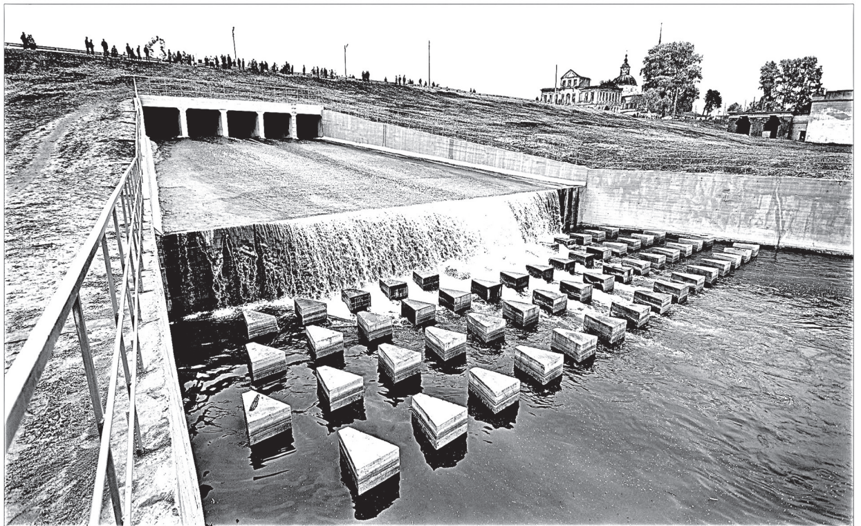
Надежность железобетонного сброса вне сомнения

Семь лет назад истек гарантийный срок эксплуатации ГЭС после ремонта, который провели специалисты «Комиэнерго». С этого времени состояние гидроузла оценивалось как предаварийное - сооружения не отвечали требованиям безопасности, в паводок возникла вероятность ЧС, нижней части поселка грозило затопление. Энергетики отказались от дальнейшего содержания объекта, его передали в собственность Койгородскому району. Начиная с 2006 года, минприроды Коми ежегодно направляло заявки в Рос-